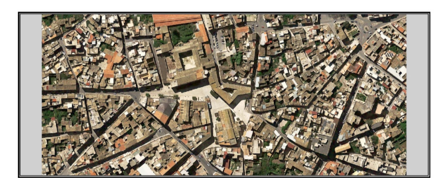
Tavola 2.b Planimetria - Tipologie edilizie (art. 3 L.R. n.13/2015) Scala 1:500