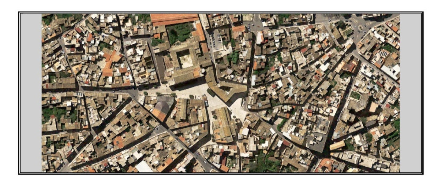
Tavola 2.a Planimetria - Tipologie edilizie (art. 3 L.R. n.13/2015) Scala 1:500