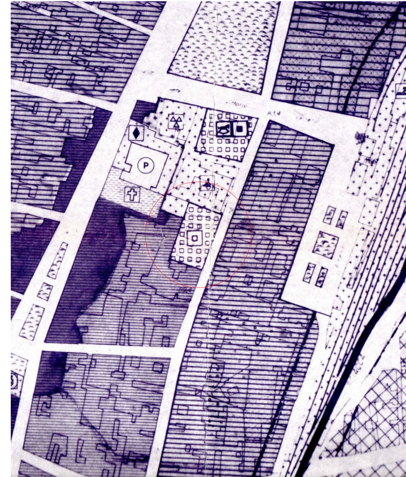
Stralcio P.R.G. scala 1:2000